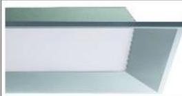
Cree: nuova plafoniera a LED per applicazioni commerciali