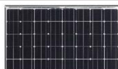
Panasonic: modulo N285 per i mercati europei