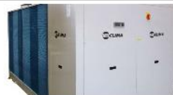
Fiorini Industries: pompe di calore ibride