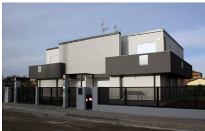
Realizzazione della residenza in legno di Carpi (MO) - Veduta frontale