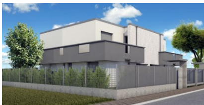
Rendering della residenza in legno di Carpi (MO) - Veduta laterale